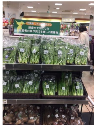
ピーコック青山店