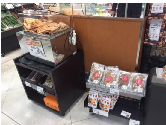
お芋コーナー（ピーコック三田店）