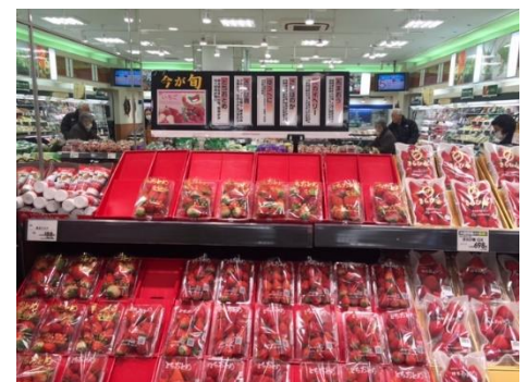
いちごコーナー （ピーコック三田店）