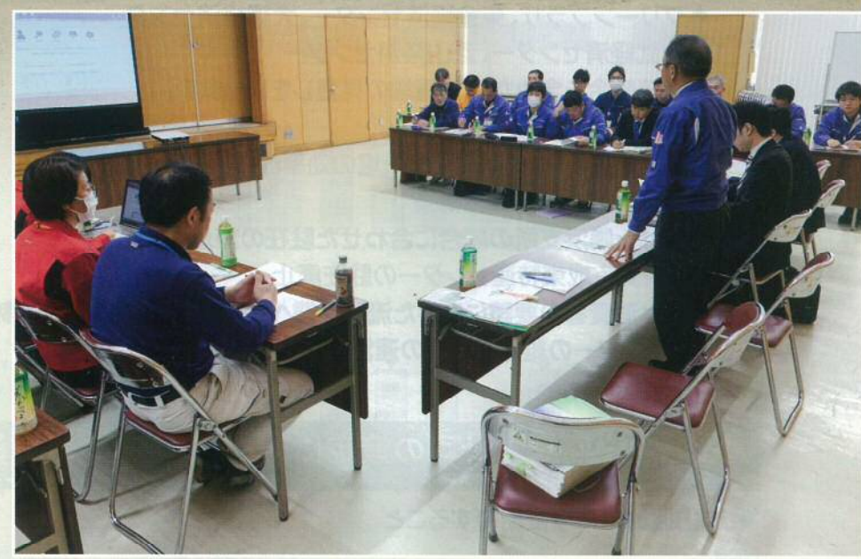
▲実践中の課題を2カ月ごとに検討する実践会議

「農業振興計画2016」は第8次中期経営計画と連動し、4年目の活動を実践中です。①作付調査、②ヒアリング実施、③打ち手対象農家の決定、④農家台帳システムを活用した経営シミュレーションによる提案(図①)といった基軸は変更ありません。提案内容は規模拡大、新規品目の他、現状の経営に関する改善点も視野に入れ、JAレベルで検討してから、訪問し、提案します。本年の打ち手対象農家は絞り込み中ですが、前年の打ち手採択農家への継続支援に加え、営農・経済センター、支援内容によって総合支所と連携した取り組みを実践しています。