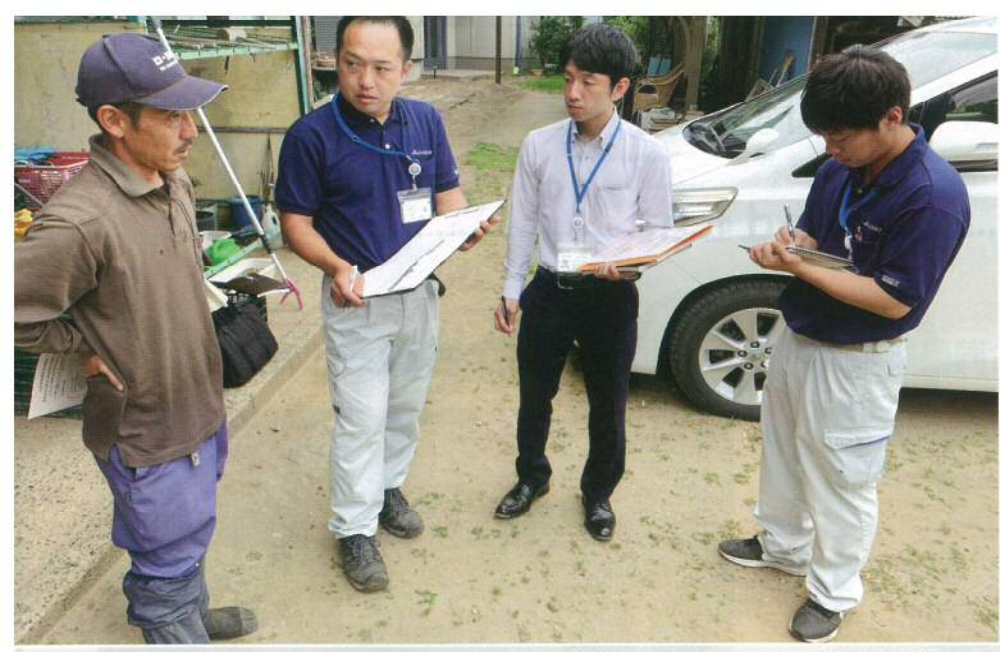
▲営農部門と金融部門の担当者(右3人)がそろって生産者宅を訪問。JAからの将来像を提案します

訪問活動はヒアリングで農家の意向を聞き取り、対象農家ごとにJAからの将来像を伝えます。組合員、JAが同じ目線(目標)で農業を考え、JAがその目標に向かって農業経営をいろいろな角度から支援する活動です。